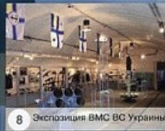
8 Экспозиция ВМС ВС Украины