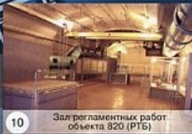
10 Зал регламентных работ объекта 820 (РТБ)