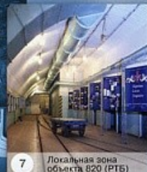
7 Локальная зона объекта 820 (РТБ)