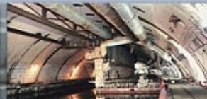
4 Батопорт сухого дока объекта 825 ГТС