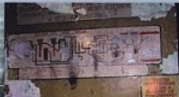
3 Минно-торпедная часть. Электротехническая схема торпеды