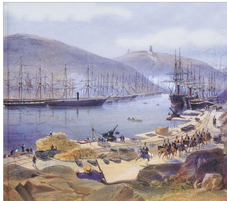
Строительство Балаклавской железной дороги

До окончания Крымской войны в Балаклаве базировались английская армия и флот. Англичане соорудили деревянную набережную, также был проведен водопровод и построены шоссейные дороги. Кроме того, в феврале-марте 1854 года англичанами была построена первая в Крыму Балаклавская железная дорога длиной 12,8 км, она соединяла Балаклавскую бухту и военное депо в районе Сапун-горы. После войны железная дорога была разобрана и продана туркам.