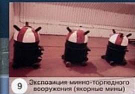
9 Экспозиция минно-торпедного вооружения (якорные мины)