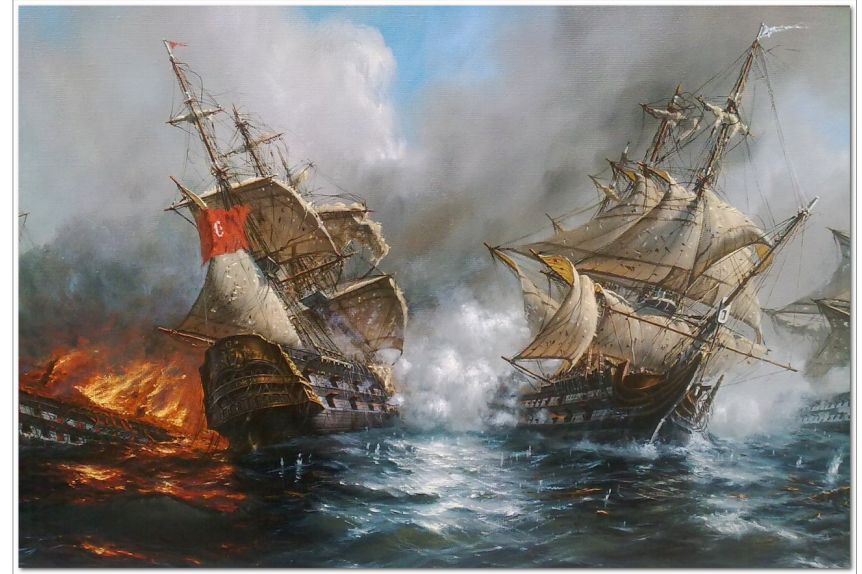
Балаклавское морское сражение.

В XVII веке между Россией и Турцией развернулась ожесточённая борьба за выход к Чёрному морю. Одним из важных центров событий тех лет стала Балаклавская бухта. Именно в ней в годы русско-турецкой войны состоялось крупное Балаклавское морское сражение.