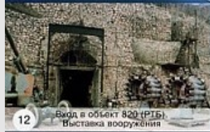
12 Вход в объект 820 (РТБ). Выставка вооружения