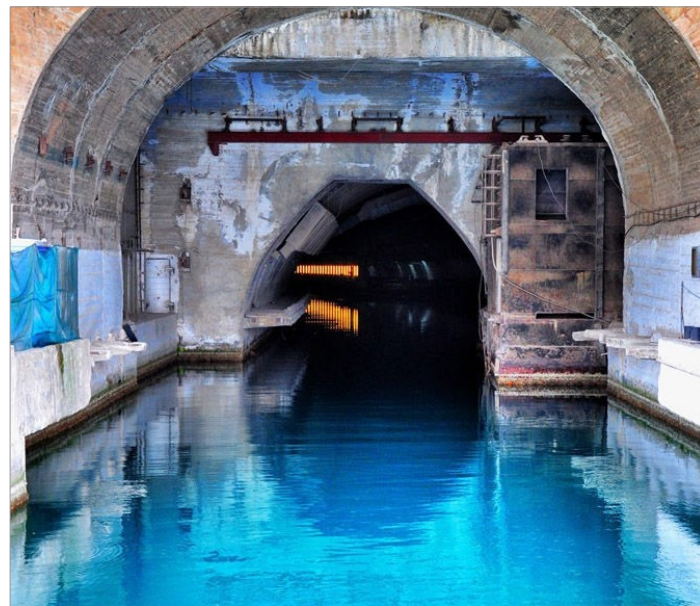
«Объект 825 ГТС»

База была сразу же засекречена и получила ничего не говорящее название «Объект 825 ГТС».