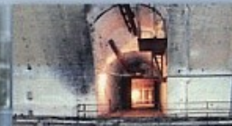
5 Погрузочная площадка объекта 820 (РТБ)