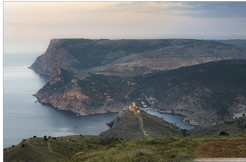
Крепость Чембало на скале ( в центре снимка ) на входе в Балаклавскую бухту

В 1475 году ее захватили турки, переименовав в Балык-Юве - "Рыбье гнездо", что позднее трансформировалось в «Балаклаву».