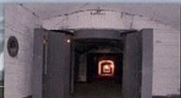
2 Противоавиационные ворота объекта 825 ГТС