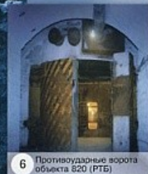
6 Противоавиационные ворота объекта 820 (РТБ)