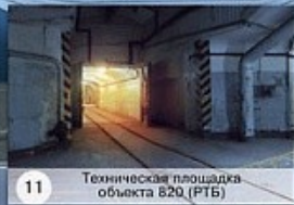
11 Техническая площадка объекта 820 (РТБ)