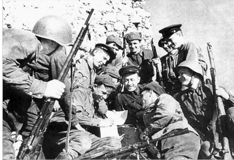
Защитники генуэзской башни Чембало (Балаклава). Май 1942 года

Крепость Чембало вновь, как и в древности становится последним оборонительным рубежом Балаклавы. Защитники Генуэзской крепости, заняв 20 ноября оборону, за несколько месяцев отбили до 70-ти штурмов фашистов, не потеряв ни одного человека. Оборона Балаклавы длилась с 4 ноября 1941года по 29 июня 1942г. А в 1944 году, 15-16 апреля, советские войска вышли к оборонительным рубежам противника и уже 18 апреля Балаклава была освобождена.