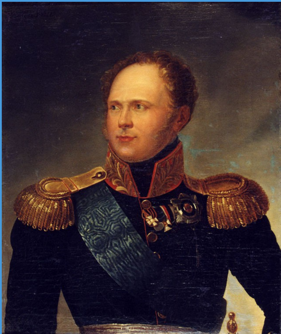
Александр I (1800-1825гг)

Первый русский император, который поручил разработать проект конституционных преобразований