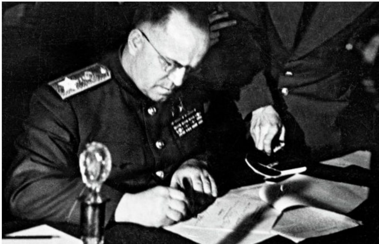
Маршал Советского Союза Георгий Константинович Жуков подписывает Акт о безоговорочной капитуляции Германии