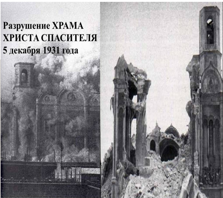
Разрушение ХРАМА ХРИСТА СПАСИТЕЛЯ 5 декабря 1931 года