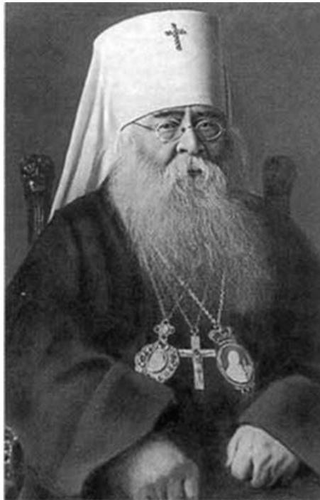
Митрополит Сергей (Страгородский)