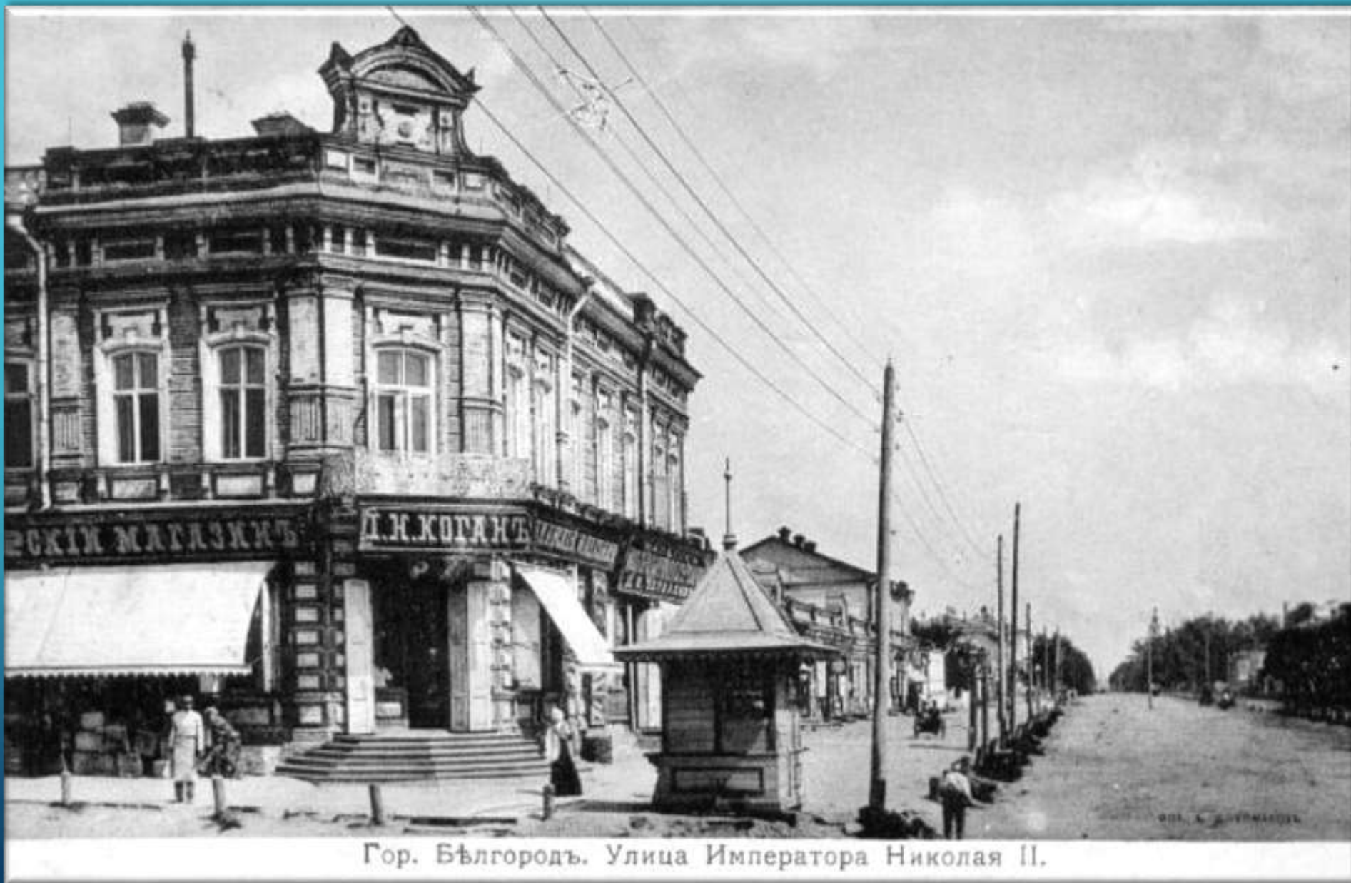
Гор. Бѣлгородъ. Улица Императора Николая II.